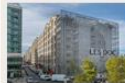
Les Docks Marseille 3 759 m 2