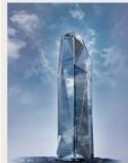
HEKLA La Défense 3 800 m 2