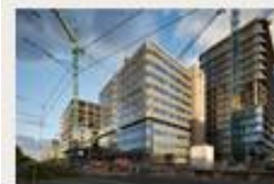
Atrium Amsterdam 1 771 m 2