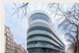
In town Paris 9 e 2 696 m 2